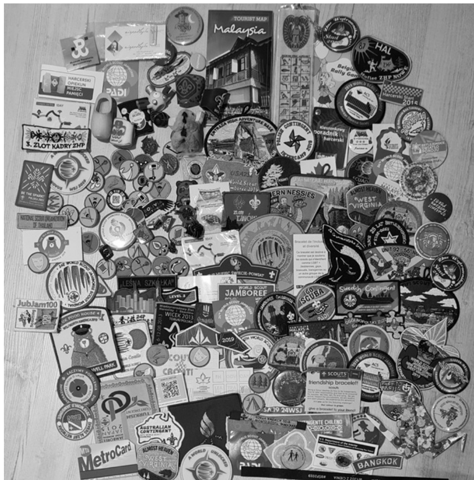
Il. 7. Plakietki, naszywki, oznaki i odznaki harcerskie i skautowe.

Spuścizny członków Związku Harcerstwa Polskiego stanowią bogate źródło informacji na temat historii harcerstwa. Wchodzące w ich skład dokumenty, pamiątki doskonale ukazują obraz ich działalności harcerskiej. Uzupełniają także wiedzę o dziejach harcerstwa w Chorągwi Kujawsko-Pomorskiej ZHP, którą historycy zazwyczaj posiadają z przeprowadzanych analiz podstawowych źródeł historycznych, czyli m.in. sprawozdań, rozkazów, uchwał itd. Omówione w artykule przykłady stanowią wyłącz-