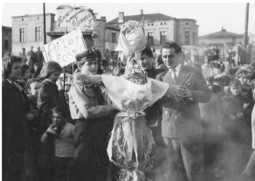
Il. 6. Powitanie wiosny w Świeciu w II połowy lat 50–tych XX wieku.