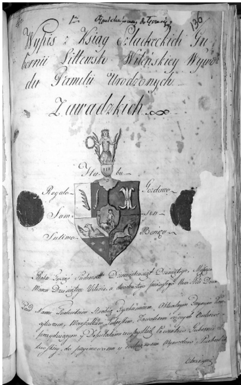
Il. 3. Wypis z Ksiąg Szlacheckich Gubernii Litewskiej Wileńskiej Wywodu Familii Urodzonych Zawadzkich, CDIAK, sygn. 966-1-17, s. 136.